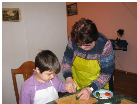
Простая нарезка овощей

При изучении разделов «Торговля», «Средства связи», «Культура поведения» используются сюжетно – ролевые игры («В магазине», «На почте», «В гостях», «В Театре», «В музее» и т.д.) Воспроизводя в игре конкретные жизненные ситуации, обучающиеся применяют усвоенные ими знания и приемы. На этих уроках дети учатся правильно вести себя в той или иной ситуации (при расставании и встрече, в театре и музее, в транспорте, в магазине, в гостях), учатся выбирать и вручать подарки, создавать подарки своими руками, делать покупки, принимать гостей, культурно разговаривать по телефону. При объяснении темы «Средства связи» обязательно используются для заполнения почтовые бланки, карточки, конверты.