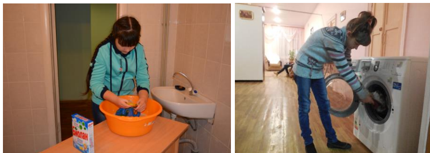
Правила и приёмы стирки вещей из различной ткани

Например, при изучении раздела «Одежда и обувь» дети учатся подбирать одежду и обувь по индивидуальным особенностям, по сезону, ухаживать за обувью, узнают о таких предприятиях бытового обслуживания, как прачечная и химчистка. Также при изучении раздела «Одежда и обувь» дети знакомятся с разными способами ухода за одеждой. Это стирка одежды, мелкий ремонт одежды (пришивание пуговицы, петель, наложение заплат), глажка белья. При изучении раздела «Одежда и обувь» большое внимание уделяется правилам техники безопасности при работе с утюгом, иголкой, ножницами.