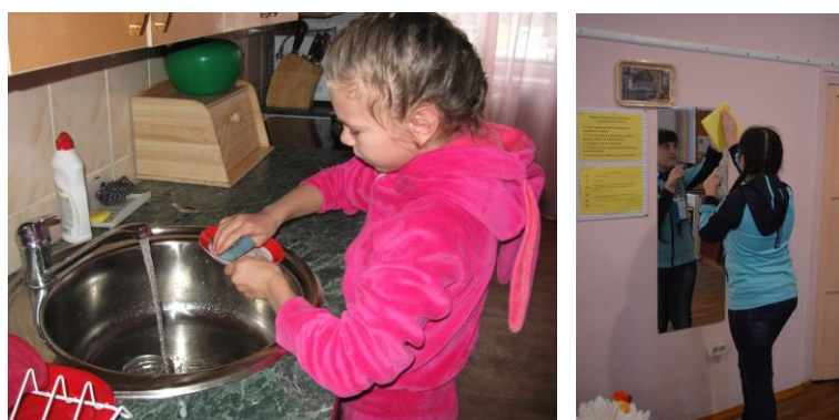
Повседневная сухая и влажная уборка

При изучении раздела «Жилище» дети узнают о гигиенических требованиях к жилищу, учатся производить уборку квартиры.